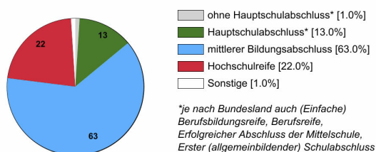
Ausbildungsbereich Industrie und Handel